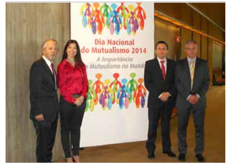
Autoridades de Odema y de la Mutualidad Portuguesa durante el encuentro en Lisboa