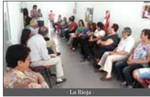
- La Rioja -