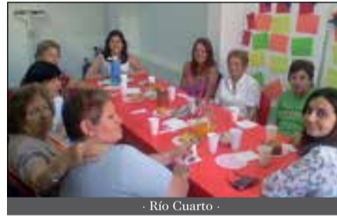
- Río Cuarto -