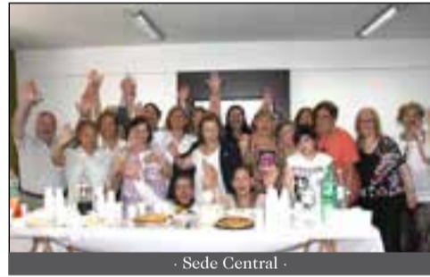
- Sede Central -