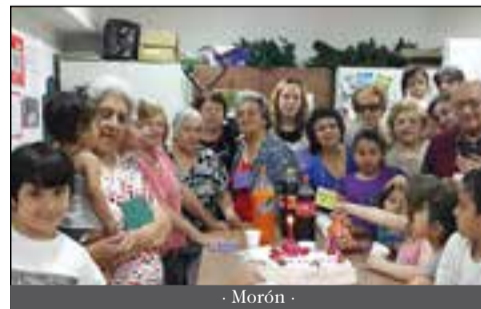
- Morón -