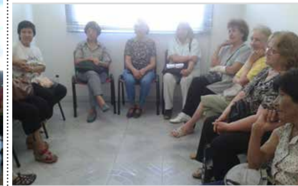
Actividades para todos los gustos en Quilmes