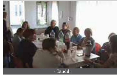
- Tandil -