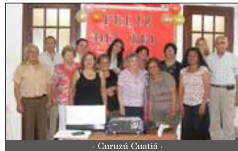
- Curuzú Cuatiá -