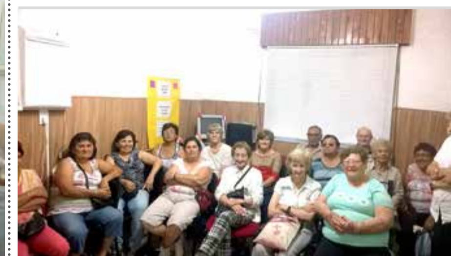
Asociados de Tucumán participaron de una charla de salud sobre cuidado de los pies

En el final se sortearon distintos premios y se compartió un refrigerio saludable acorde a la ocasión.-