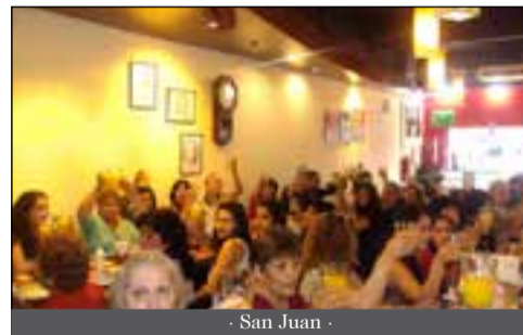
- San Juan -