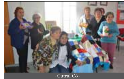
- Central C6 -