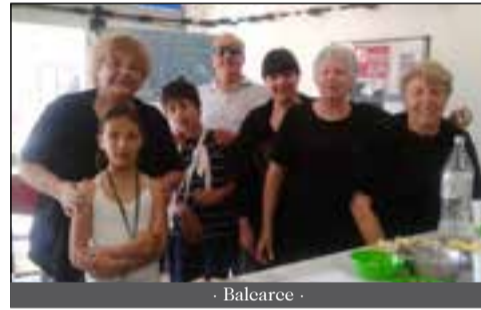
- Balcarce -