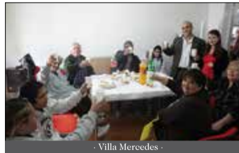
- Villa Mercedes -