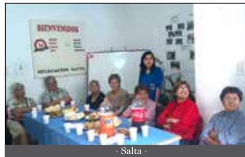
- Salta -