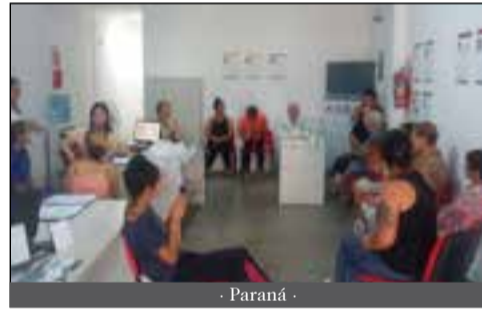
- Paraná -