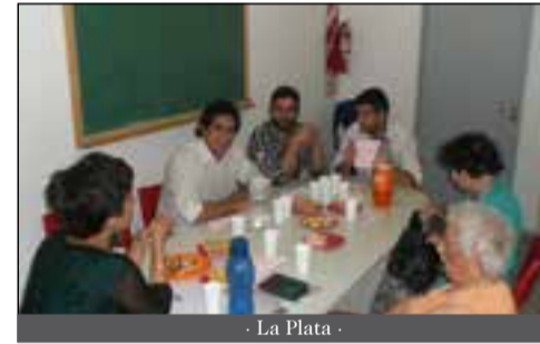
- La Plata -