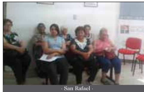
- San Rafael -