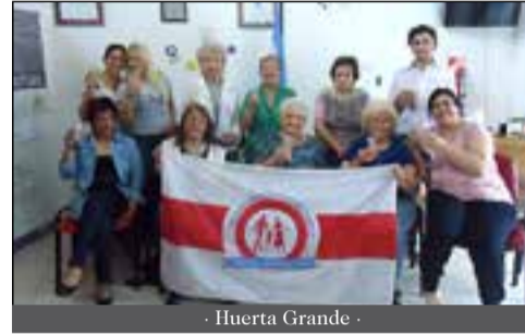
- Huerta Grande -