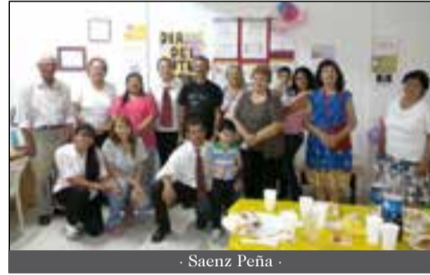
- Saenz Peña -