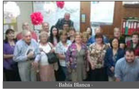
- Bahía Blanca -