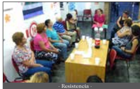
- Resistencia -