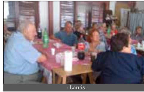
- Lanús -