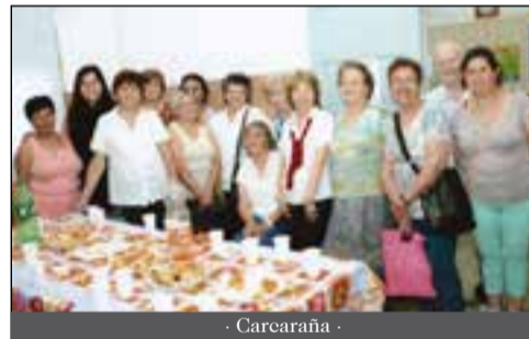
- Carcaraña -