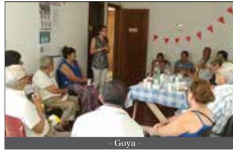
- Goya -