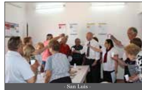
- San Luis -