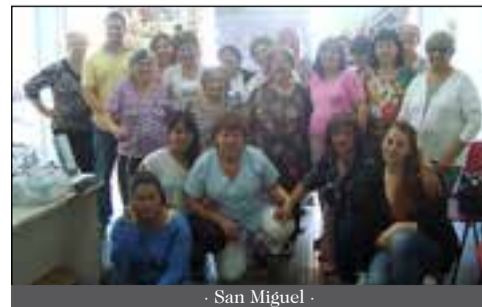
- San Miguel -