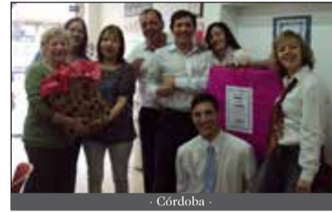
- Córdoba -