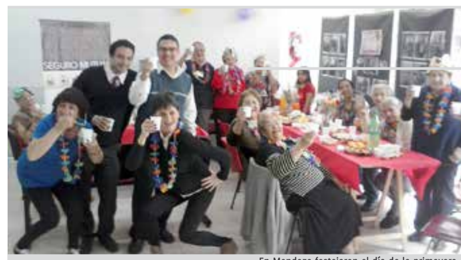
En Mendoza festejaron el día de la primavera

También se llevó a cabo una campaña de promoción y protección de derechos de niños y adolescentes. Al efecto se preparó material sobre el tema y cuentos para trabajar conjuntamente los chicos y sus familias en el hogar.-