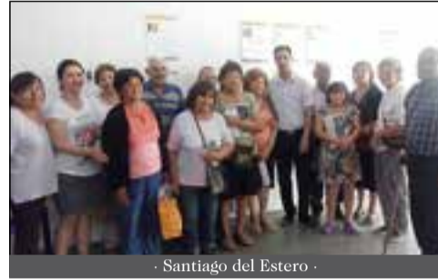
- Santiago del Estero -