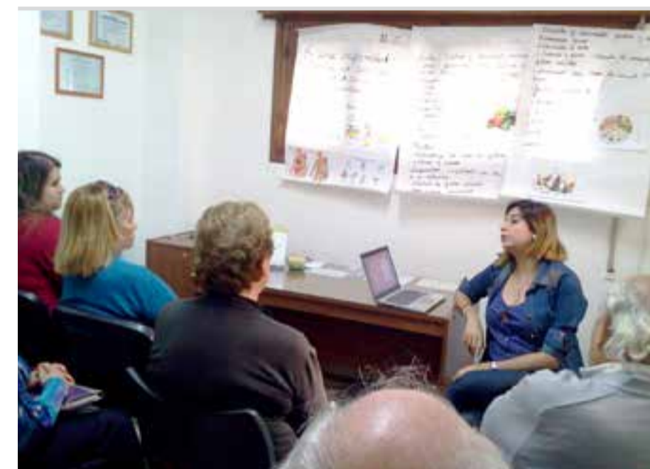
Alimentación saludable, tema central del encuentro en Carcaraña

Se compartió información y experiencia personales, lo cual arroja un balance más que positivo, dado que una buena alimentación sana y saludable es la base de una mejor calidad de vida.-