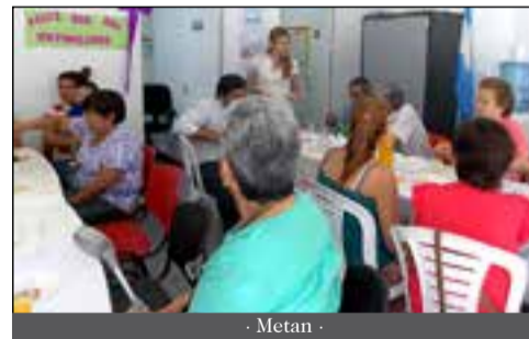
- Metán -