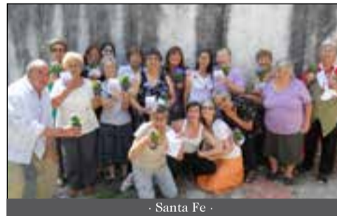
- Santa Fe -