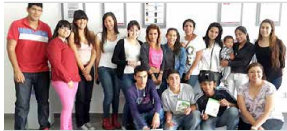
Alumnos secundarios y universitarios en la delegación La Rioja

Los jóvenes manifestaron gratitud por lo aprendido, por la apertura de la Mutual para recibirlos y sus deseos que se les brinden otros talleres.-