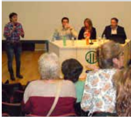
AMPF colabora con CUDAIO en Santa Fe

La jornada contó con la organización conjunta de Odema, AMPF y el CUDAIO.-