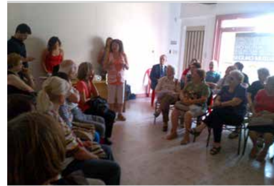
En Lanús se hizo un nuevo encuentro sobre actividad física y nutrición

de la Salud, que contó con charlas del médico de familia, la nutricionista, la psicóloga y la trabajadora social, en colaboración con todo el personal de la Mutual en Lanús.