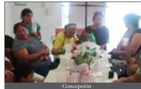
- Concepción -