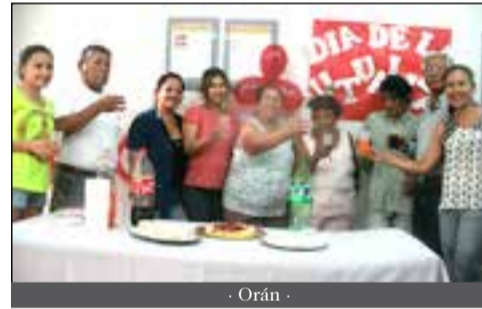
- Orán -