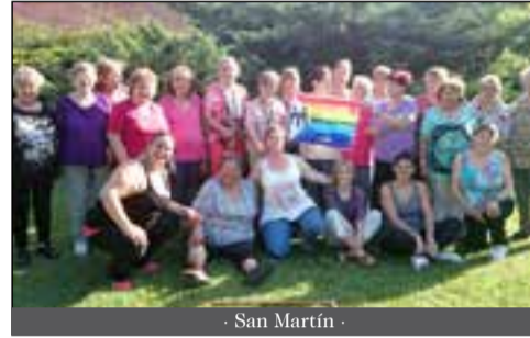
- San Martín -