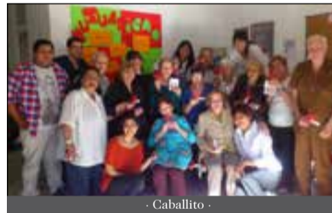
- Caballito -