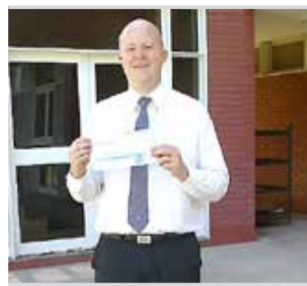
AMPF hizo una donación de tapas al Garrahan

El delegado local junto a la trabajadora social, en representación de empleados y asociados, depositaron el producto de varios meses de colecta en la sede de la empresa Transporte Libertadores, que solidariamente y sin cargo transporta los envíos hasta el hospital porteño.-