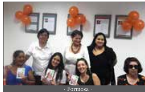
- Formosa -