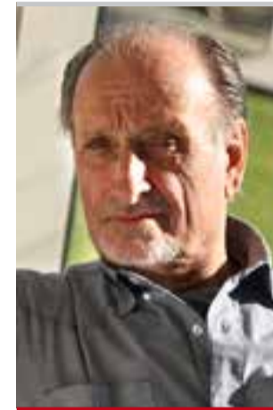
Por Alfredo Sigliano

generada en nuestro país, por distintas razones relacionadas con la situación económica general, que debemos ir superando con gran esfuerzo de imaginación y de iniciativas de innovación y desarrollo de nuestros servicios, no fueron óbice para que como ha ocurrido a lo largo de la historia de nuestras mutuales, las medidas adoptadas puntualmente hicieran posible una motivación de trabajo en el conjunto de los componentes de nuestras organizaciones, que han hecho realidad emprendimientos muy significativos que consolidan el presente y el futuro de las mutuales. Podríamos citar como ejemplo de esa actitud positiva y proactiva algunas de las acciones concretadas durante este año, tal vez las más importantes, entre otras,