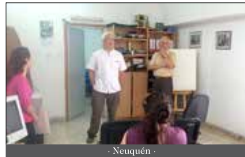
- Neuquén -