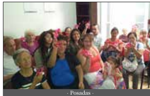
- Posadas -