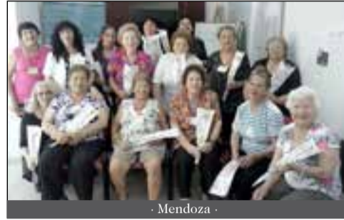
- Mendoza -